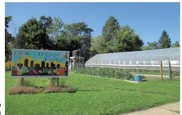
Ferme urbaine à Buffalo (New York, USA)

J'ai choisi de découvrir ces initiatives au Québec et aux Etats-Unis dans un premier temps du fait d'un important nombre d'écrits sur le sujet. Puis, Cuba fut ma dernière destination, dans un contexte complètement différent, je trouvais intéressant de faire la comparaison avec ce que j'avais vu avant. Le statut insulaire de Cuba, ajouté au blocus des Etats-Unis, favorise le développement de l'agriculture urbaine et périurbaine soutenue par l'État en vue d'une certaine autonomie alimentaire.