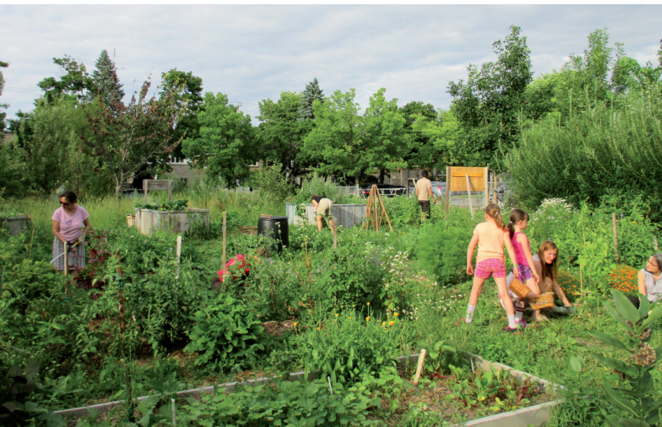
Jardin partagé à Montréal (Canada)

m'a permis de percevoir les bourses de l'enseignement supérieur qui, ajouté à mes réserves constituées lors de mes jobs d'été, ont suffi à mon entretien pendant cette période à l'étranger et en France. ◆